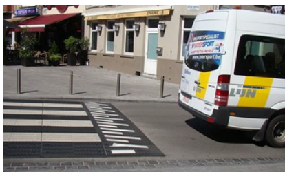
Model 10 cm